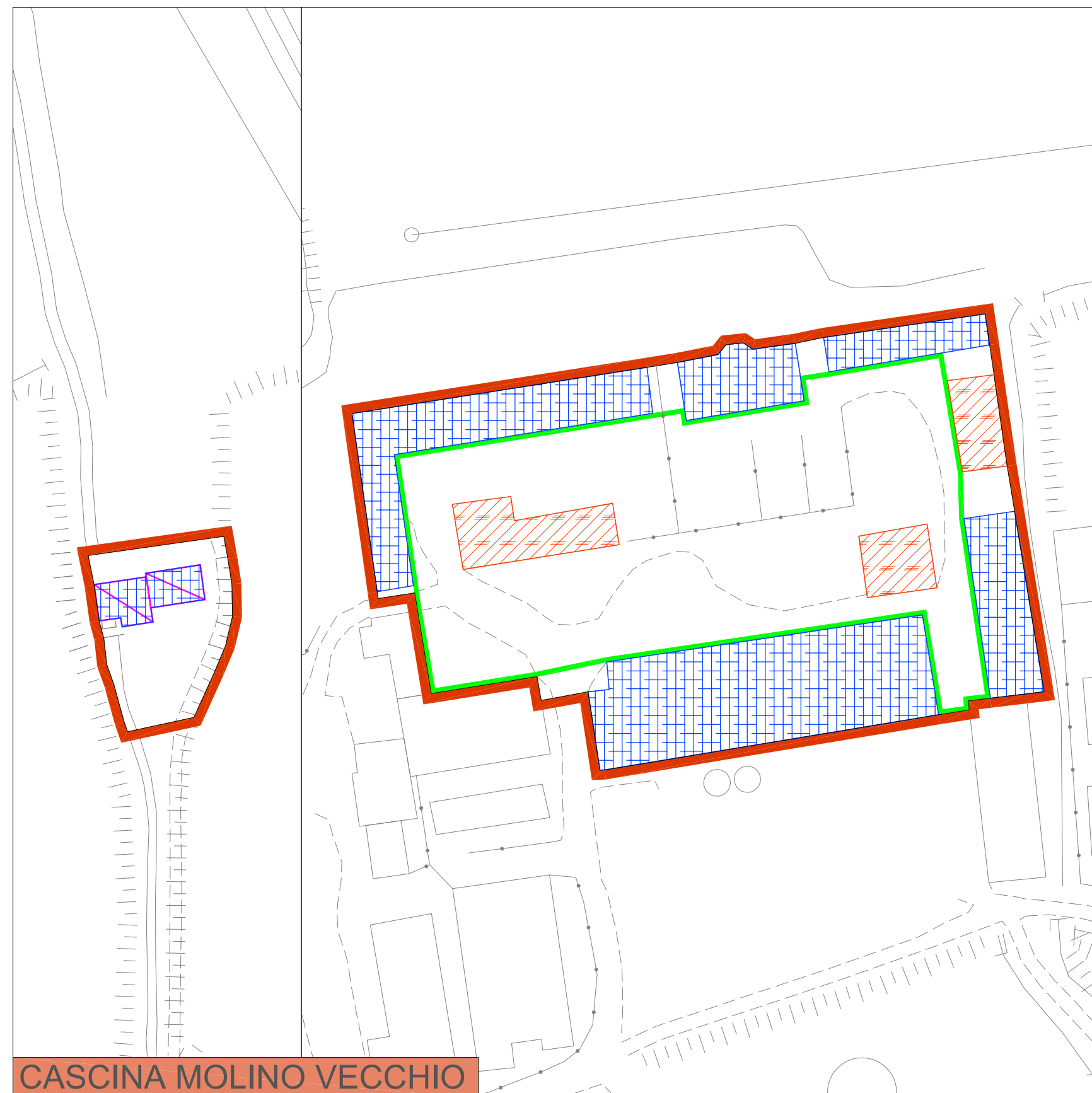
CASCINA MOLINO VECCHIO